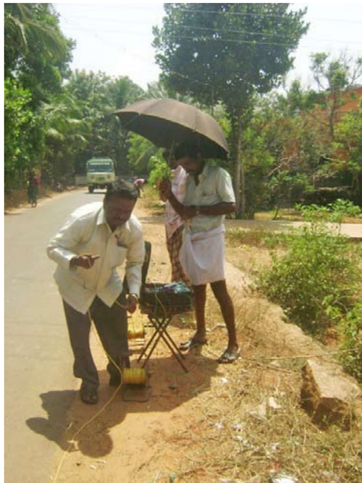
15 marzo 2011, ore 7.30 locali.

Panchayat che gestisce questo territorio, assicurandosi che qualsiasi intervento rispetti come obiettivo finale il welfare della comunità di Paravan. Una volta ricevuta la relazione del geologo, sarebbe dunque stato necessario presentare domanda con i dettagli di tutto il piano di lavoro.